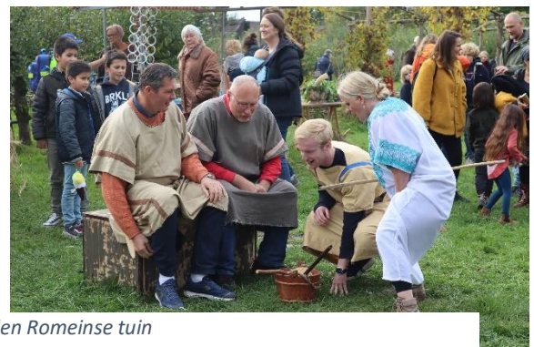
Optreden Romeinse tuin

Op 17 oktober hebben we enkele sketches opgevoerd in de Romeinse tuin in het kader van de dag van de Arnhems geschiedenis. Dit was even een uitstapje voor ons want wij gingen ons even verdiepen in de verhalen van vroeger in plaats van die van nu. Hierdoor leerden onze spelers als ook ons publiek iets over hoe de Romeinen lang gelden in Arnhem geleefd hebben. Ook hebben onze spelers hier veel plezier aan beleefd.