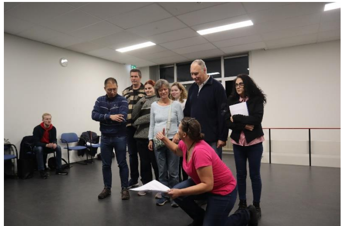
Nog live repetitie Het midden van de wereld

*12 december 2021 kwam het hoorspel en podcast van deze voorstelling online te staan