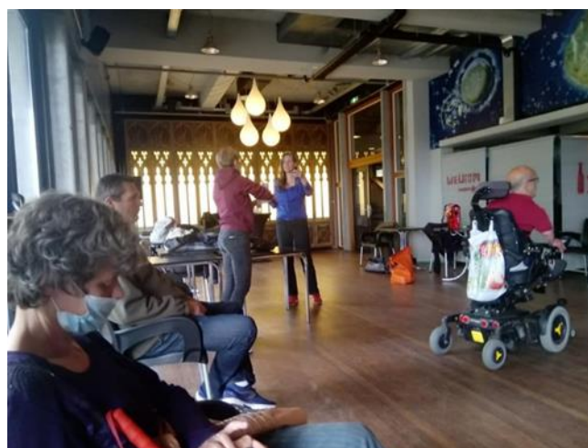
Vlak voor optreden Waalzinnig festival in Lindeberg repeteren

Doordat dit een livestream optreden was hadden we het grootste publiek ooit bij één voorstelling, er keken op een bepaald moment namelijk wel meer dan 100 mensen naar de livestream. Tevens hebben we via de spelers gehoord dat de mensen die zij kenden en gekeken hebben zeer enthousiast waren over ons optreden. Ze vonden ons het beste optreden van de avond en werden aan het denken gezet over het loslaten van bepaalde situaties en je eigen pad kiezen. We waren ontzettend blij met deze reacties ook al konden we niet live met ons publiek in gesprek. Ook onze spelers hebben aan gegeven dat ze aan deze periode toch veel gehad hebben. Ze waren blij dat ze elkaar konden blijven zien, voelden zich door toneelspelen ook zelf zekerder van hun zaak en waren meer na gaan denken over hun eigen situatie en die van anderen op het gebied van alleen zijn en je al dan niet toch verbonden voelen. De voorstelling is terug te zien via: https://www.youtube.com/watch?v=VpdfEyIMUQc&t=4s