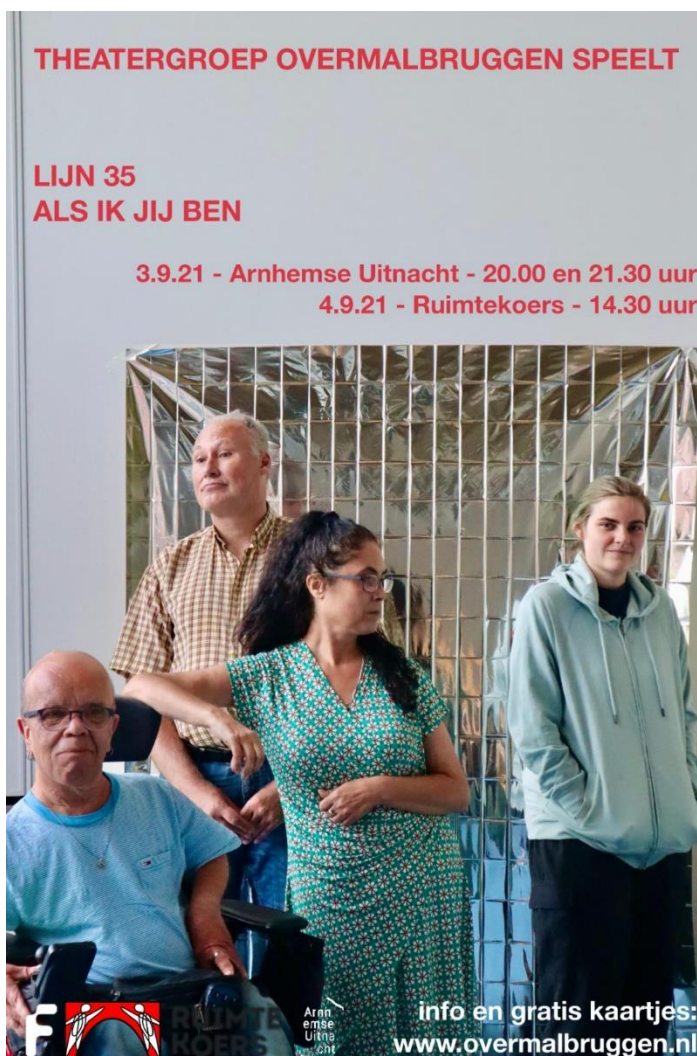
Poster voorstelling september 2021

In dit verslag zal u kunnen lezen welke activiteiten we afgelopen jaar precies hebben ondernomen en hoe we dit financieel hebben klaargespeeld. Door de coronacrisis was het een bewogen jaar maar we zijn ondanks dat erg blij dat we toch nog driemaal een voorstelling hebben kunnen maken en opvoeren. Tevens zijn de plannen voor komend jaar ook al in ontwikkeling.