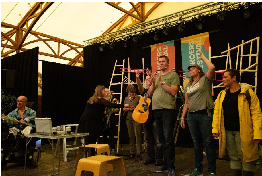
Applaus bij voorstelling Eenzaamheid en Verbondenheid

Na deze eerste theaterles is dit initiatief gegroeid. Op 5 juli 2019 gaven we onze eerste voorstellingen in Geniet in het Buisshuis en op het Ruimtekoersfestival. Vanaf september 2019 zijn we weer begonnen met theaterlessen, ditmaal in buurthuis het Huis voor de Wijk die samen met ons een (culturele) ontmoetingsplek wil worden voor vele groepen in de wijk. Op 15 april 2020 zijn we hierna officieel een stichting geworden met een bestuur en adviesraad. We hebben tevens een vaste zakelijk leider en werken met afwisselende artistiek leiders en regisseurs. Deze stichting streeft ernaar niet enkel via theater buurtcontacten te bevorderen en zo de sociale cohesie in Arnhem-Zuid en omstreken te versterken maar dit ook te doen via dans en muziek. Naast theaters hebben zijn we ook begonnen met gastworkshops in deze disciplines. In dit verslag zal u kunnen lezen welke activiteiten we afgelopen jaar precies hebben ondernomen en hoe we dit financieel hebben klaargespeeld. Door de coronacrisis was het een bewogen jaar maar we zijn ondanks dat erg blij dat we toch nog tweemaal een voorstelling hebben kunnen maken en opvoeren en de plannen voor komend jaar ook al in ontwikkeling zijn. In dit verslag laten we u graag zien wat we afgelopen jaar op poten hebben kunnen zetten en wat onze plannen voor de toekomst zijn.